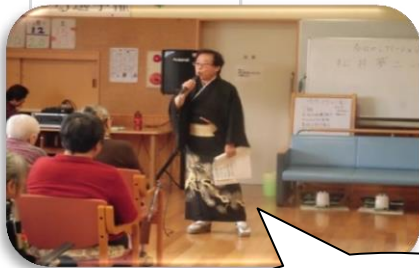
松井夢二氏による 演歌歌謡ショー★