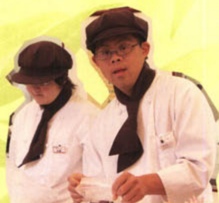
接客の時のユニフォーム姿で…