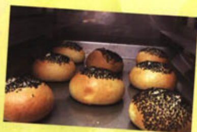
すべてのパン・菓子はこの溶岩窯で焼いています