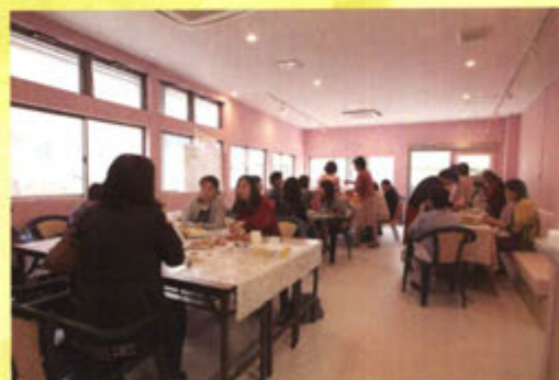
5月11日 プレオープンの試食会