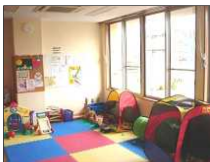
ボランティアルーム(ゆうづルーム)