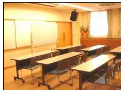
多目的室 B - 1.B - 2