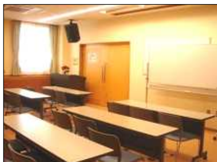
多目的室 A - 1.A - 2